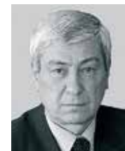
Чихачин Юрий Анатольевич, директор Федеральной службы по финансовому мониторингу